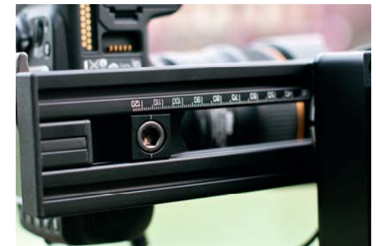
Ist der exakte Nodalpunkt gefunden, lässt sich die Kamera mittels eines kleinen Schlittens fixieren, der im Alu-Profil beweglich gelagert ist. Eine Skala gibt dabei Auskunft über die genaue Position. Einmal ausgemessen, kann man so auch für unterschiedliche Brennweiten den Nodalpunkt schnell wiederfinden.