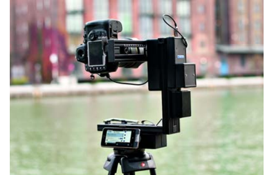
Der aufgebaute Rodeon VR Station CL der Firma Claus. Unten das Smartphone mit der Steuerungssoftware, dahinter der Schrittmotor für die horizontale Drehung. An der Hochkantachse befindet sich der Akku, darüber die Kontrollereinheit mit der Steuerhardware und dem gegenüber der Schrittmotor für die vertikalen Bewegungen. Die Kamera, hier eine Nikon D700, wird per Fernauslösekabel automatisch über die Kontrollereinheit ausgelöst.

Eines merkt man schnell, wenn man sich mit Kugelpanoramen beschäftigt – egal mit welcher Brennweite man fotografiert: Der Standort für das Foto sollte gut überlegt sein: Hat man bei normalen Panoramen den Anspruch, etwas Sehenswertes vor die Linse zu bekommen, muss man bei dieser Art von →