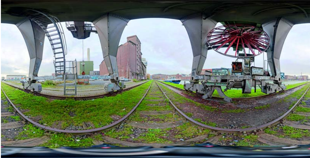
Kugelpanoramen bieten eine verrückte Sicht auf die Welt. Je mehr es in alle Himmelsrichtungen zu entdecken gibt, desto interessanter werden die Bilder.