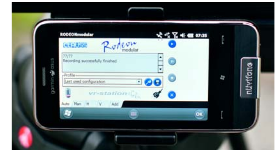
Die Software Rodeon Modular, hier auf dem mitgelieferten Smartphone. Für die Bedienung benötigt man etwas Fingerspitzengefühl, alternativ nutzt man den im Handy versteckten Bedienstift. Die Software ist einfach aufgebaut und man kann mit ein paar Klicks die Anzahl der zu gewinschten Bilder auf der Horizontalen wie auch auf der Vertikalen einstellen. Zusätzlich lassen sich Belichtungsreihen, Wartezeiten bei langen Belichtungszeiten sowie ein Twister-Modus aktivieren, in dem der Kopf für die jeweiligen Fotos nicht anhält.